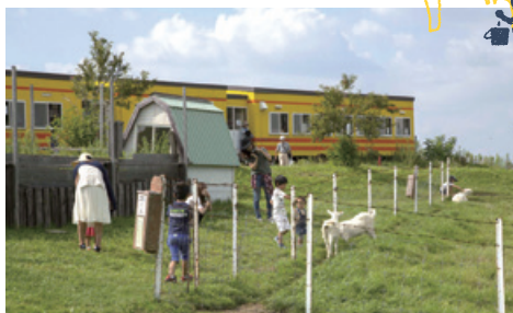
夕張郡長沼町東9線南2 ☎ 0123-88-0011

豊かな自然の中で様々な動物とふれあえる、空知の老舗的な観光牧場。広々とした牧草地で馬に乗ったり、牛の乳しぼりをしたり、仔やぎにミルクをあげたりする経験は、子供たちの心を豊かに育むはず！牛乳でバターやアイスを作る体験もできます。昭和51年の創立以来、3世代に渡り通うファミリーも多いこの場所。さあ、あなたも思い出をここで。