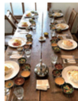
夕張郡長沼町東4線南10 ☎ 0123-76-7306