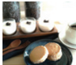
夕張郡長沼町銀座南1-7-3 ☎ 0123-76-9618

白い壁に揺れる灯、挽きたて豆の香り。こだわりのコーヒーと焼きたてのフィナンシェが味わえる、マチの自慢のおしゃれカフェです。